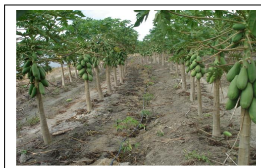
Fig. 4 Seringueira e mamão