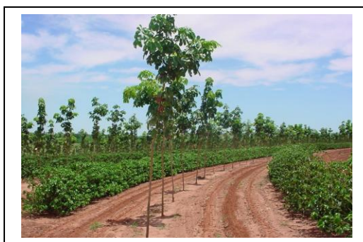
Fig. 5 Seringueira e café