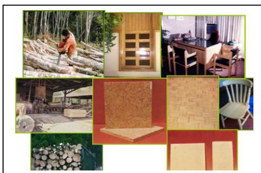
Fig. 3 Móveis com madeira de seringueira