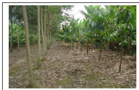
Fig. 6 Seringueira e cacau